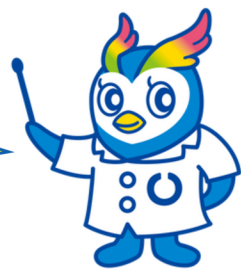
日眼医公式マスコットキャラクター