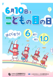
こどもの目の日 啓発ポスター