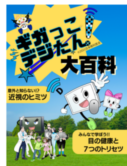
『ギガっこデジたん!』大百科